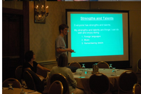
Tuvimos 61 sesiones Entretenimiento para los chicos,